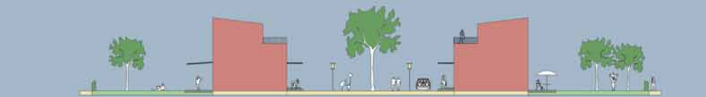
Die Wohnhöfe haben großzügige Gemeinschaftsbereiche und private Gärten

Die bauliche Struktur der Wohnhöfe erlaubt einerseits eine öffentliche Durchwegung in Richtung Ringgleisweg andererseits nachbarschaftliche Einheiten und private Rückzugsräume für die Bewohner. Diese nachfrageorientierten Wohnformen befinden sich in integrierter städtischer Lage und bieten insbesondere Familien eine Alternative zum Eigenheim im Umland.