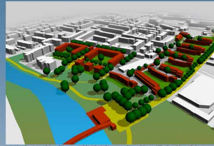
Im Vordergrund ist die neue Okerbrücke zu sehen, hier trifft der Ringgleisweg auf den Okeruferweg. Im Hintergrund befindet sich die Siedlung Eichtal.

Verknüpfung des Quartiers mit dem Fluss und dem Okerufergrünzug durch direkte Wegeverbindungen.