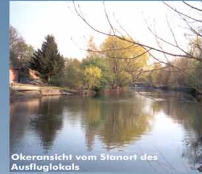
Okeransicht vom Standort des Ausflugslokals

Mit der Oker erreicht der Ringgleisweg ein wichtiges Ziel. Die Planung sieht dementsprechend eine Fußgängerbrücke und ein Ausflugslokal mit Terrasse am Wasser und Bootsverleih vor. Der geplante Platz am Brückenkopf ist Treffpunkt für Spaziergänger, Freizeitsportler und Bewohner. Am Okerufer ermöglichen Streuobstwiesen eine flexible Freiraumnutzung für die Menschen des Stadtteils.