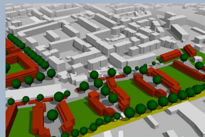
Die Wohnhöfe vermitteln zwischen der Siedlung Eichtal im Hintergrund und dem Ringgleisweg im Vordergrund.