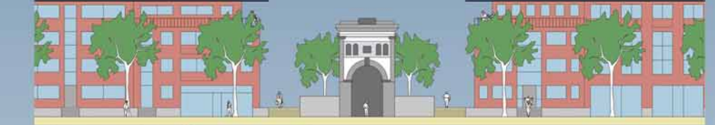
Das alte Juteportal eingefasst von neuer Bebauung

Die Einfassung durch eine städtische Baustruktur rückt das Juteportal in ein geschlossenes Straßenbild. Der alte Fabrikingang wird der zentrale Durchgang zum Grünzug und zur Oker. Die Blockrandbebauung öffnet sich zum Grünzug und löst sich in einer Reihe von Stadtvillen auf.